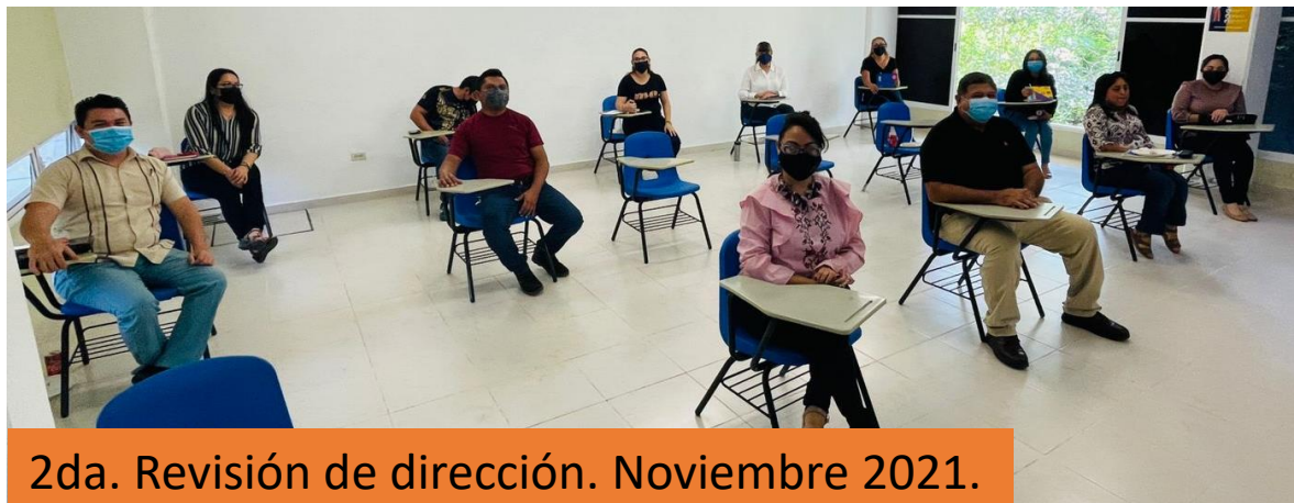
2da. Revisión de dirección. Noviembre 2021.

La primera reunión de revisión de la Dirección se llevará a cabo en febrero , en la cual participarán las autoridades de la Facultad de Educación, en conjunto con el área de calidad de la dependencia, el área de calidad de la DGPLANEI y las áreas de los procesos certificados y de buenas prácticas institucionales de calidad para revisar el estado del sistema de calidad y establecer acuerdos.