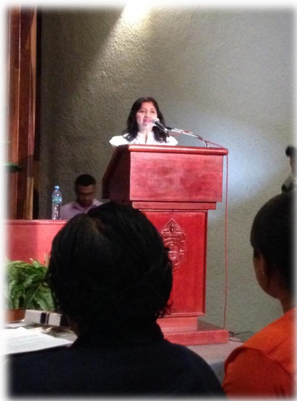
Congreso sobre Investigación y Desarrollo “Jóvenes Investigadores”, Centro Cultural Universitario, UADY. 29 y 30 de noviembre de 2013