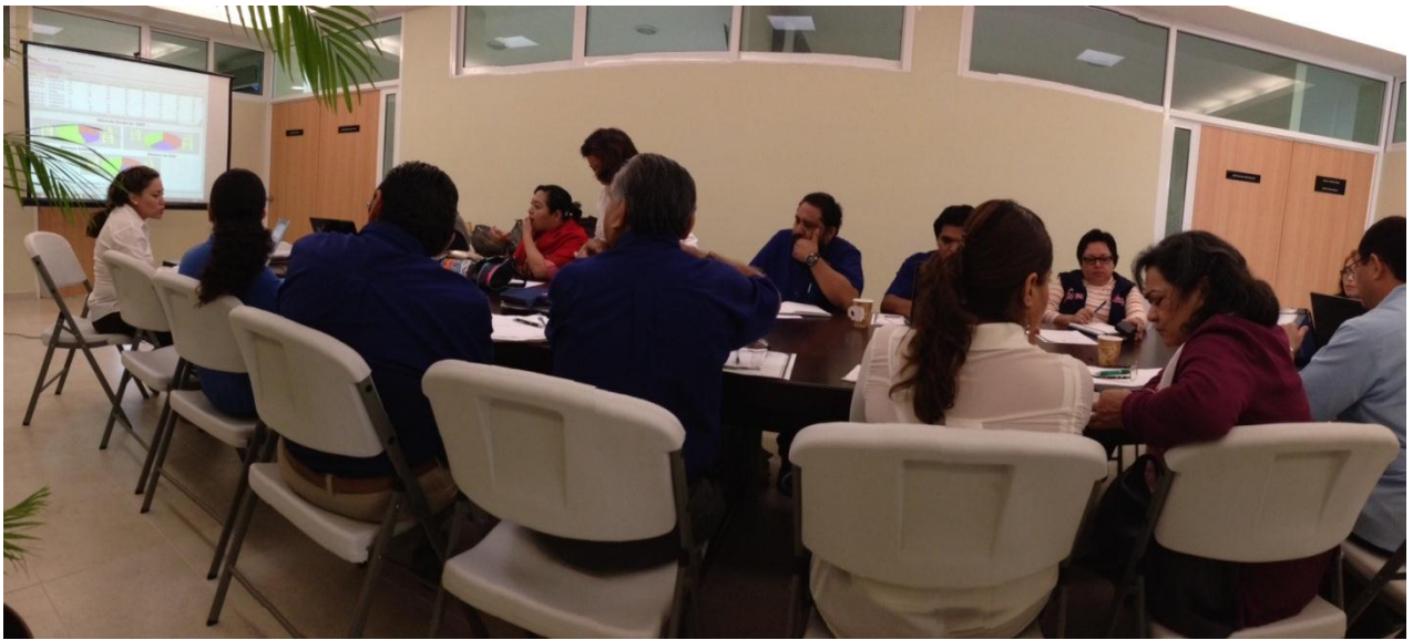
12va. Reunión del Comité Promotor del Programa Institucional de Tutorías, Facultad de Psicología, UADY. 2 de diciembre de 2013