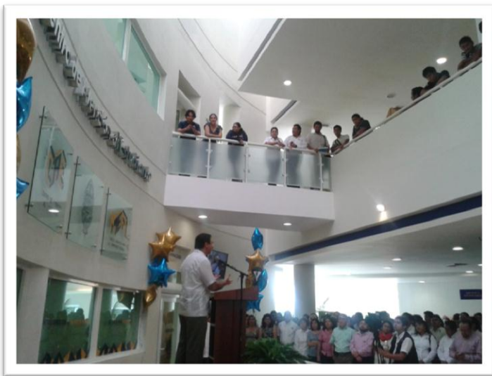
Inauguración del Centro de Atención al Estudiante, Campus de Ciencias Exactas e Ingenierías, UADY. 12 de noviembre de 2013